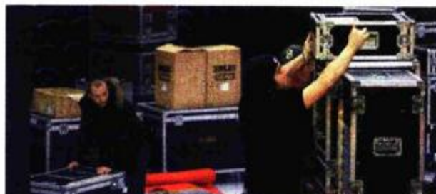
Veliko pospremanje razglasa i opreme pristigle iz Njemačke