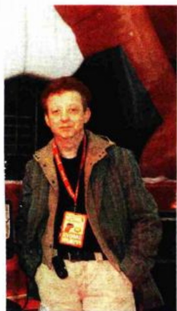
sljednje tehničke provjere za koncert